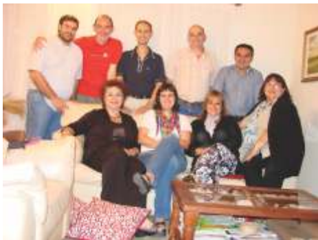
Equipo Córdoba XXI

Para nosotros fue un EAPRE muy especial porque con él se inició el proceso de discernimiento para la elección del nuevo Hogar Responsable del Sector que comenzará su servicio a fines de este año, y nos llevó a reflexionar sobre qué huellas deja este servicio en nuestras vidas.